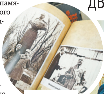
Книга Давида Драгунского «Годы в броне»

Для школьников была организована экскурсия по музее ратной истории и трудовой славы ДК «Выстрел». Ребятам показали легендарную книгу героя «Годы в броне». Кроме того, школьники увидели уникальные фотографии, документы, образцы оружия и другие артефакты эпохи Великой Отечественной войны. Кроме того, в рамках Дня па-