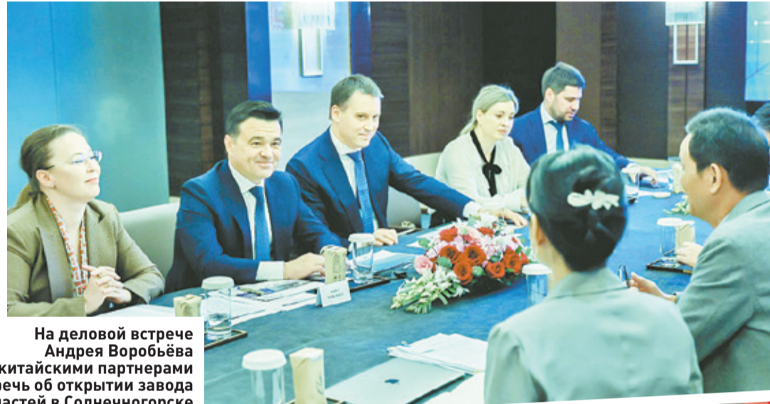
На деловой встрече Андрея Воробьёва с китайскими партнерами шла речь об открытии завода запчастей в Солнечногорске

ЭКОНОМИКА | Глава региона обсудил в Китае развитие автомобильного производства